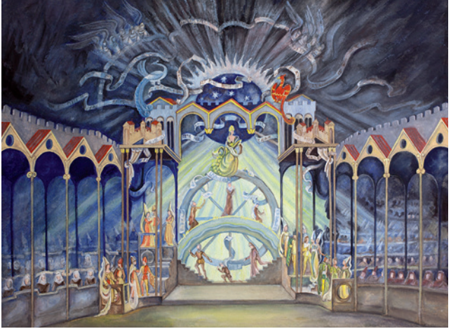
Bühnenbildentwurf von Ludwig Sievert, Uraufführung Carmina Burana, Frankfurter Oper, 8. Juni 1937

Themen wie Liebe und Leidenschaft, Werden und Vergehen sowie die Freude am Feiern. Als Metapher hierfür steht das Rad der Fortuna, der römischen Glücks- und Schicksalsgöttin. Das oberbayerische Kloster Benediktbeuern beherbergte viele Jahre lang die Handschrift, obwohl sie weltliche Themen behandelt und den Klerus kritisiert. Dort wird die Liedersammlung im Rahmen der Säkularisation und Aufhebung der bayerischen Klöster im Jahr 1803 entdeckt. 1847 erscheint erstmals eine Gesamtausgabe der Schrift, die nach ihrem Fundort benannt wird: Carmina Burana (lat.: Lieder aus Beuern).