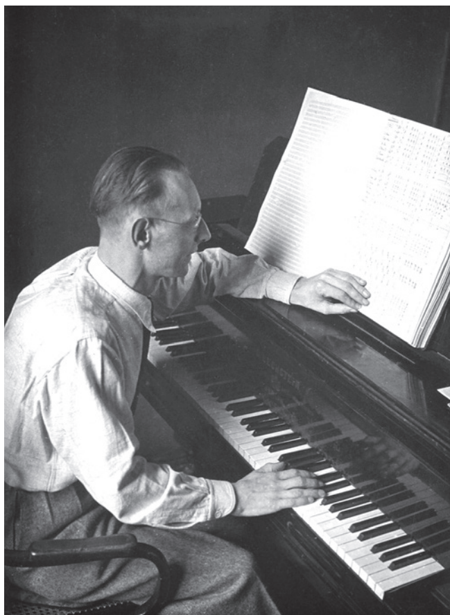
Carl Orff am Klavier, Fotografie, 1938