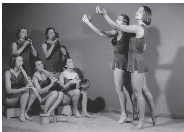
Tanz- und Musik-Aufführung von Schülerinnen der Güntherschule, Fotografie, 1934