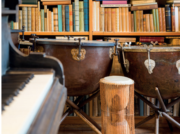
Instrumente aus dem Orff'schen Arbeitszimmer, Carl-Orff-Stiftung, Dießen am Ammersee

Arbeitszimmer. Dabei werden auch Orffs Rolle während der Zeit des Nationalsozialismus und sein einflussreiches Schaffen im Bereich der Musikpädagogik beleuchtet. Die Besucher*innen haben die Möglichkeit, das Orff'sche Instrumentarium selbst auszuprobieren.