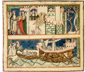
Titelblatt und Illustration aus dem Codex, Druckgrafik, 13. Jh.